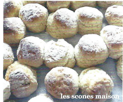
les scones maison