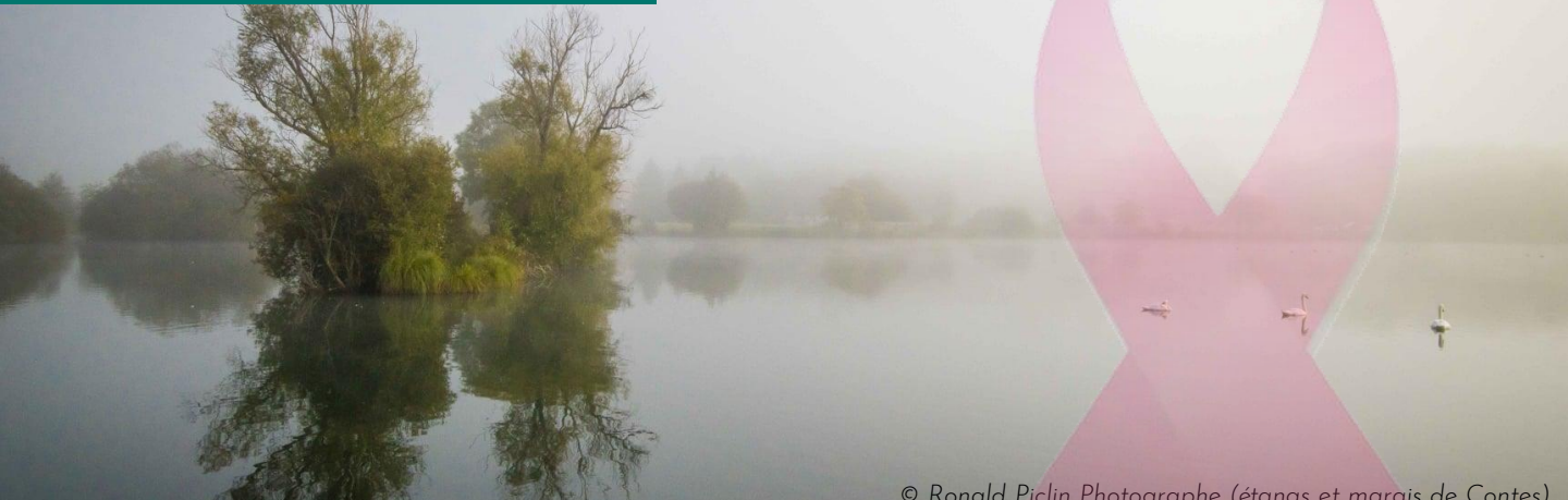
(étangs et marais de Contes)