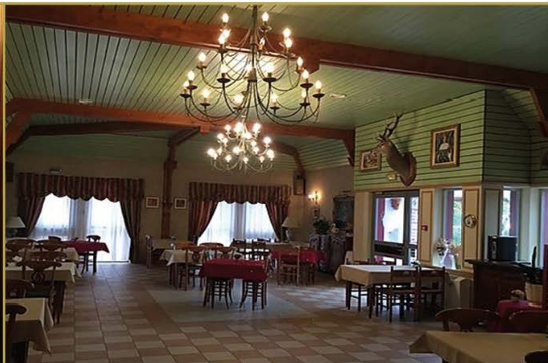
Mardi 13 octobre : repas médiéval Charles VI à Azincourt - 03 21 41 53 00