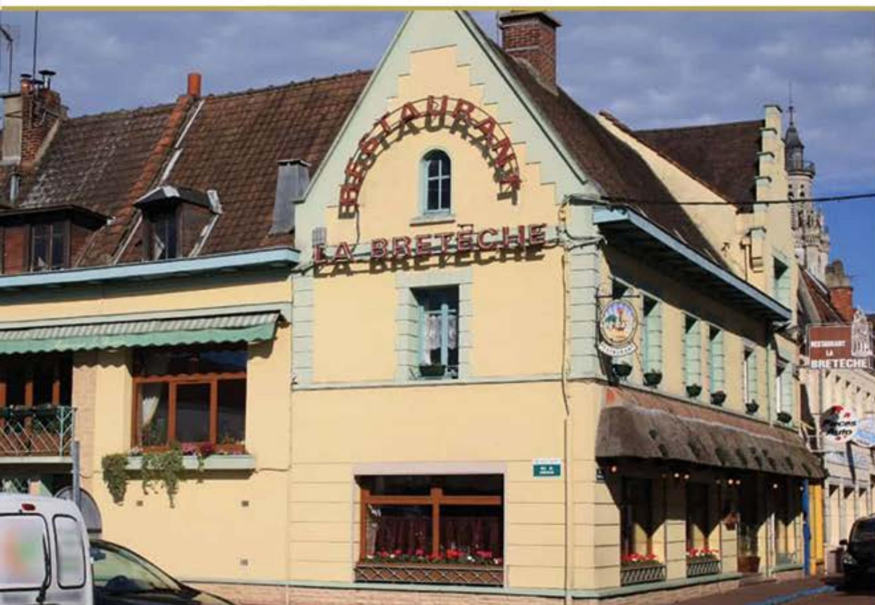
Mardi 20 octobre : repas 18 ème siècle La Bretèche à Hesdin - 03 21 86 80 87