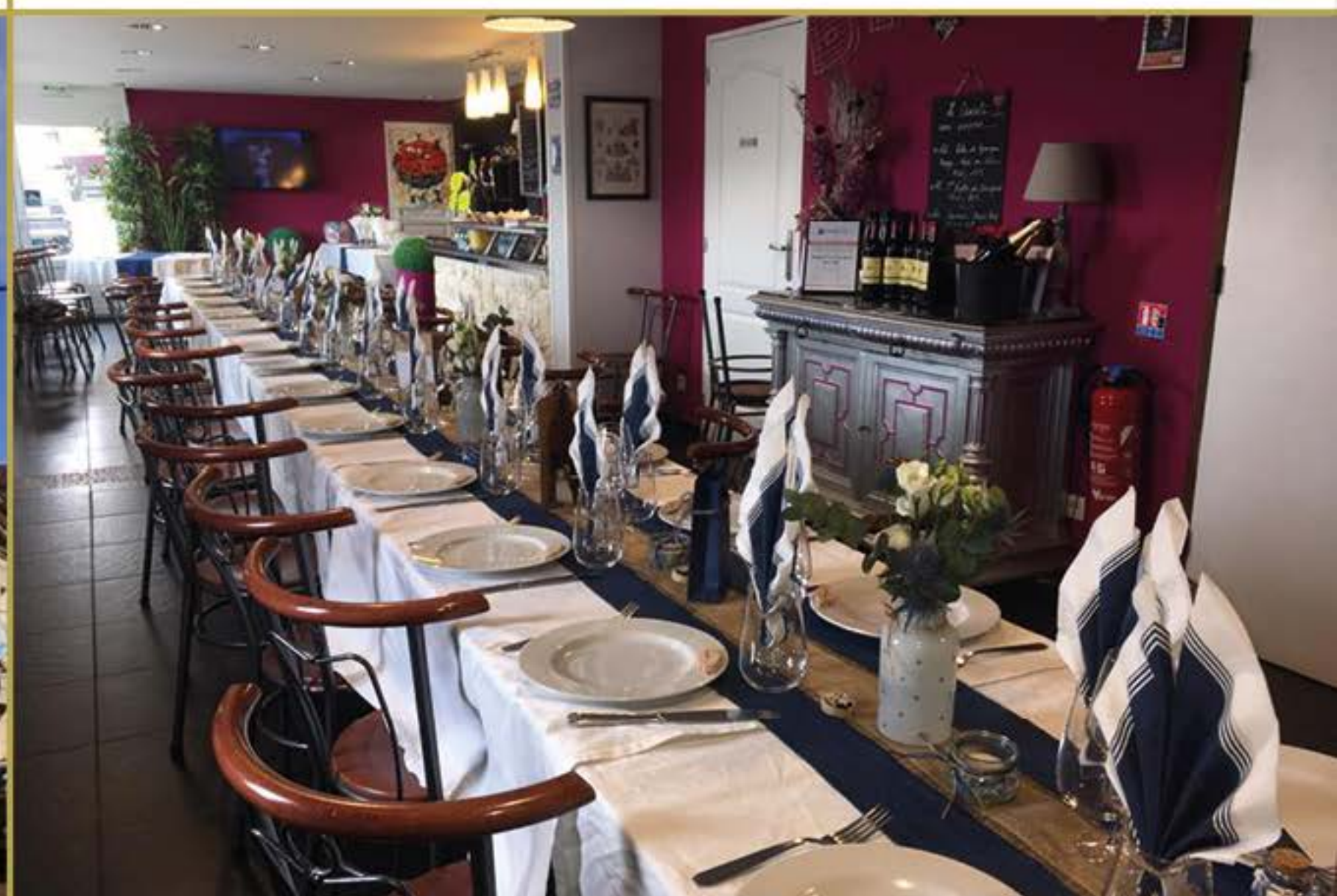
Mardi 27 octobre : repas «pendant la guerre» Bistrot Gourmand à Campagne-lès-Hesdin - 03 21 05 70 51