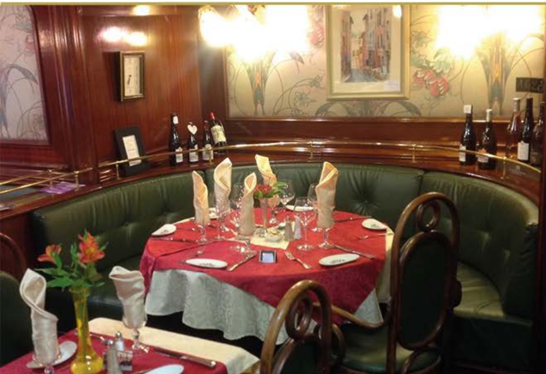
Mardi 06 octobre : repas antique La Belle Epoque à Hesdin - 03 21 86 42 89