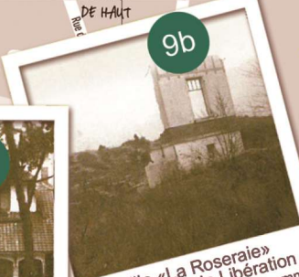
Villa «La Rosaie» 1939 avant la guerre