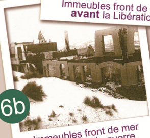
Immeubles front de mer avant la Libération