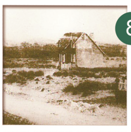
L'ÉGLISE Le dimanche 12 août 1928 s'est déroulée en grande pompe l'inauguration de l'Eglise Sainte Thérèse de l'enfant Jésus construite par l'entreprise Taburiaux d'après les plans de Monsieur Lucien Dufour, architecte. Cette inauguration se fit sous la présidence de Monseigneur Julien Evêque d'Arras.