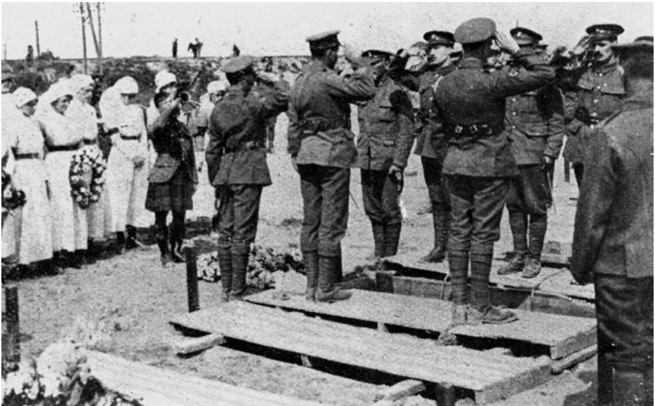
Funérailles d'une infirmière au cimetière militaire britannique Funeral of a nurse at the British Military Cemetery Begraafenis van een verpleegster op de Britse militaire begraafplaats