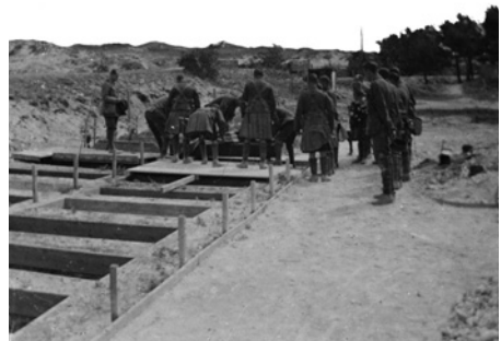
Une des premières inhumations au cimetière britannique One of the first burials at the British cemetery Een van de eerste begrafenissen op de Britse begraafplaats