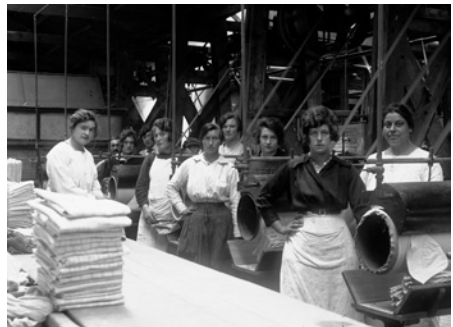
Etaploises travaillant à la blanchisserie aux abords du camp britannique Women from Etaples working at the laundry near the British camp Vrouwen uit Etaples werken in de wasserij vlakbij het Britse kamp

In spite of very difficult living conditions, 'packed like sardines' in tents and very badly fed, soldiers trained in dunes on the parade grounds, nicknamed the 'Bull Ring'. They trained for bayonet fighting, use of poison gas, marches and assault techniques, throwing of grenades and shooting. All these exercises, often dull and brutally supervised by sergeants, followed up from each other from 8 a.m. to 4 p.m. with a short break for lunch. The men who went through this training were often humiliated and harboured a growing hatred towards their officers which led to a mutiny in September 1917.