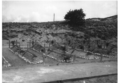
Vues du cimetière militaire britannique Views of the British military cemetery Zicht op de Britse militaire begraafplaats