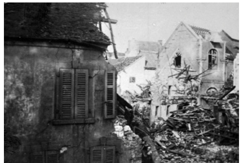
Brasserie Delaporte, rue de Rosamel Delaporte Brewery, «Rosamel» street Brasserie Delaporte, rue de Rosamel

Without being occupied by the German army, the town of Etaples suffered in 1917 and 1918 from destructive and deadly air bombings. Due to the damage sustained and the human losses, the town of Etaples was awarded the "Croix de Guerre" (War cross) during a ceremony which took place on the Main Square on December, 12th, 1920.