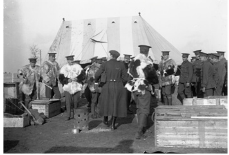
Scène d'hiver au camp, route de Boulogne Winter scene at the camp, Boulogne's Road Winterbeeld op het kamp, route de Boulogne