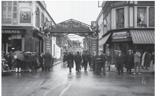
la rue d'Hérambault the "Hérambault" street in rue d'Hérambault

Vanwege de geografische ligging vlakbij het Verenigd Koninkrijk en de spoorweginfrastructuur verbleven er vier jaar lang duizenden Britse soldaten in het 'verschrikkelijke kamp' (W. Owen) van Etaples. Niet opgeroepen burgers en Britse militaire troepen leefden hier samen, onder vriendelijke of soms gespannen omstandigheden. In 1917 zijn er 100 000 mannen gelegerd in Etaples: het is het grootste Britse militaire kamp van het Westfront. Ondanks dat Etaples niet bezet was door het Duitse leger, leed het in 1917 en 1918 onder vernietigende en dodelijke luchtbombardementen. Vanwege de geleden schade en de slachtoffers kreeg de stad Etaples op 12 december 1920 tijdens een ceremonie op het Grote Plein het oorlogskruis toegekend.