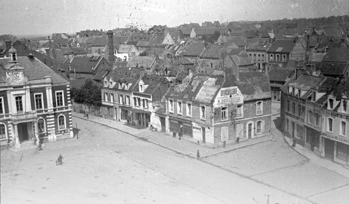
Place de la Mairie Townhall Square Plein Gemeentehuis