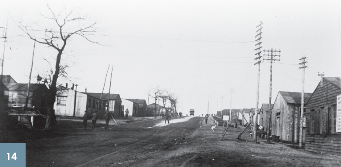
Camp de renforts britannique, route de Boulogne 1916 Camp of British re-inforcements, Boulogne's Road Brits versterkingskamp, route de Boulogne, 1916

The appointment camp or 'temporary camp' received British soldiers after a period of convalescence in hospitals located in France behind the line before their going back to infantry barracks when declared fit for service. Soldiers remained another fortnight in Etaples before their departure to be intensively trained because the British headquarters judged the military training of the armed forces was not good enough to serve at the Front.