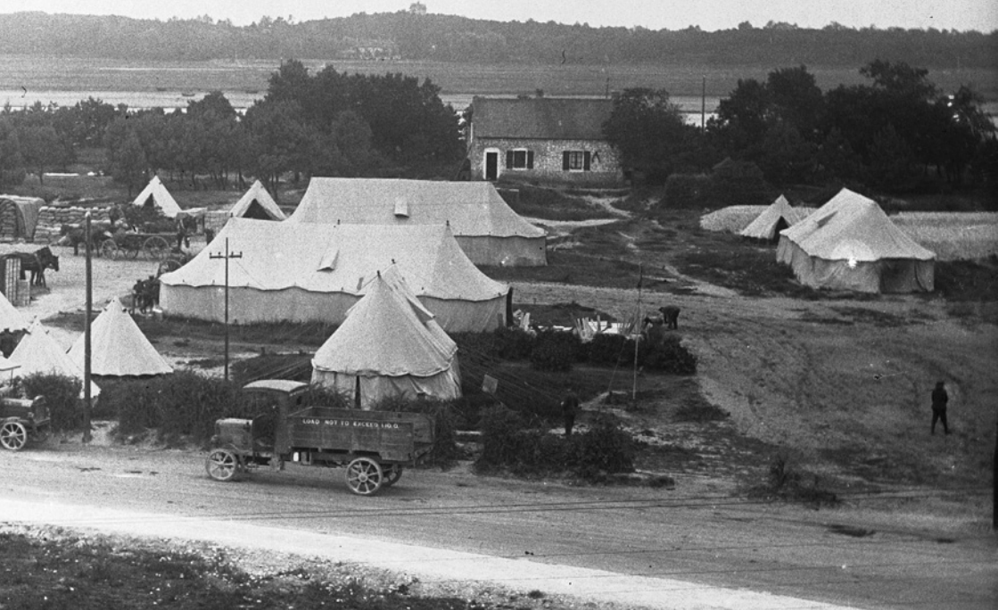
Vue du camp au Bois Hanin View of camp at Hanin's wood Zicht op het legerkamp in het Bois Hanin