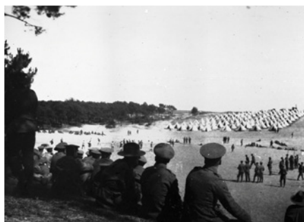
Vue du camp britannique vers Blanc-Pavé View of the British camp towards the Blanc Pavé Uitzicht vanuit het Britse legerkamp op Blanc-Pavé

The unique place of Etaples at that time will never raise a doubt: it welcomed the largest hospital premises that a government had ever built abroad.