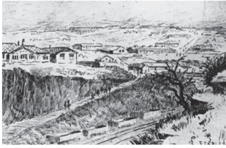
Travaux de dédoublement de la voie ferrée, 1915 Dividing work of the railway, 1915 Aanleg verdubbeling spoorweg, 1915