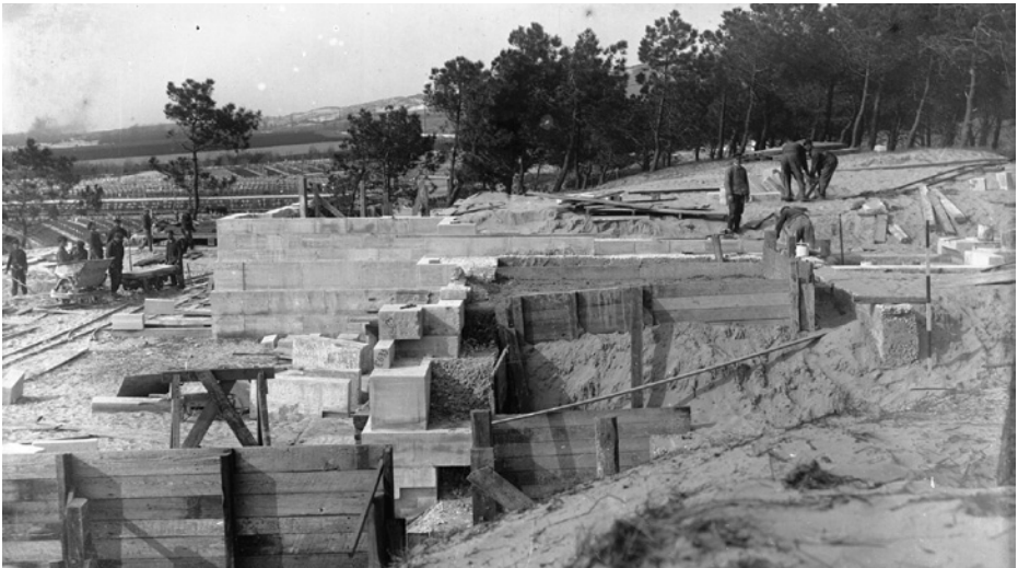
Construction du monument commémoratif du cimetière britannique d'Etaples Building of the memorial at the British cemetery Bouw van het herdenkingsmonument van de Britse begraafplaats van Etaples

At the entrance of the cemetery, a memorial designed by Sir Edwin Lutyens was inaugurated by King George V and Marshall Douglas Haig on May, 14th 1922.