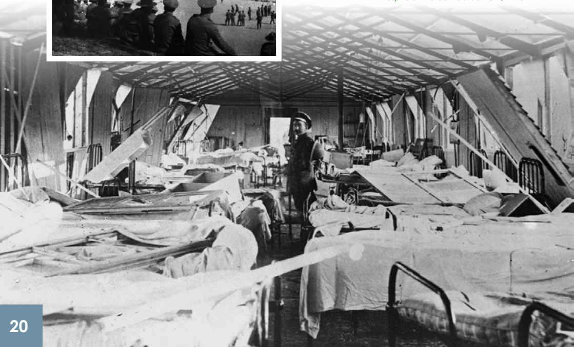
Hôpital après un bombardement, 1918 Hospitals after a bombing, 1918 Hospitalen na bombardement, 1918