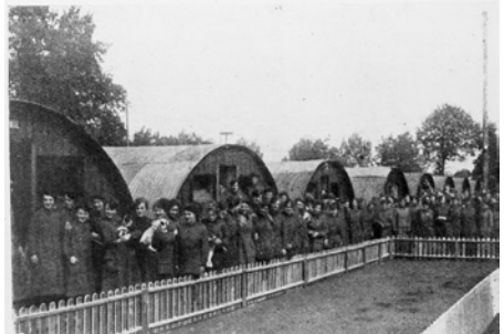
Dortoir des WAAC (Women's Army Auxiliary Corps) WAAC's dormitory (Women's Army Auxiliary Corps) Slaapzalen van de WAAC (Women's Army Auxiliary Corps)

At the end of the war, the number of women who were part of the camp was estimated at 2500.