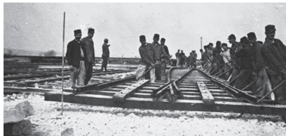
Pose de rails par le 5e génie français Laying of rails by the 5th Régiment, French Engineers Aanleg rails door het 5e geniekorps van Frankrijk