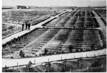
Vues du cimetière militaire britannique Views of the British military cemetery Zicht op de Britse militaire begraafplaats

Bij de ingang van de begraafplaats staat een monument dat gemaakt werd door Sir Edwin Lutyens en dat ingewijd werd door King George V en maarschalk Douglas Haig op 14 mei 1922.