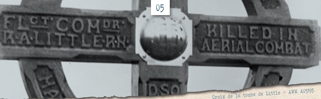
Croix de la tombe de Little - AWM A05195