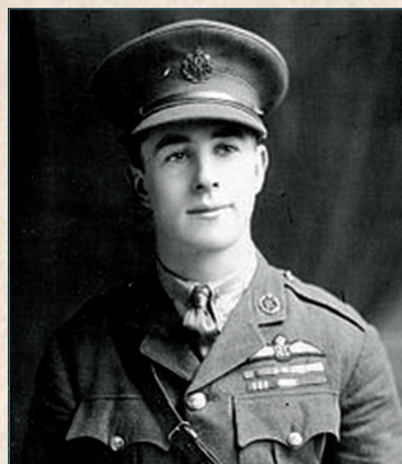
Portrait de McCudden - IWM Q 46099

Il est l'un des pilotes britanniques le plus décoré de la Première Guerre mondiale totalisant 56 victoires homologuées.