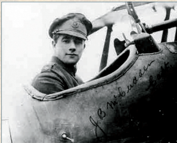
James McCudden

Il faudra nourrir, loger, soigner, organiser, entraîner, transporter toute cette masse humaine, actrice, ou victime de ce terrible conflit. Ce territoire devient ainsi une véritable fourmière, une usine pour assurer et faire la guerre.