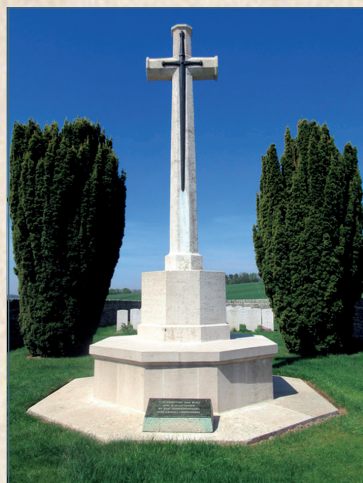
La Croix du Sacrifice - Amicale Laïque

Installée sur une base octogonale, elle porte l'épée de saint Georges, pointée vers le bas en signe de deuil.