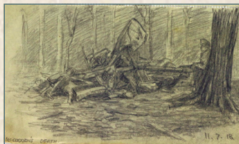
L'avion après le crash

Très vite, il se révèle être un pilote exceptionnel. Il reçoit la croix de guerre en janvier 1917 et il est promu officier. Il enchaîne alors les victoires et multiplie les actes de bravoure au-dessus de la Belgique et du Pas-de-Calais ce qui lui vaut la prestigieuse Victoria Cross .