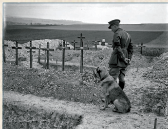
Le cimetière, avant son aménagement, juillet 1918

Pendant la guerre, les habitants des alentours venaient y observer les lieux des combats de l'Artois (Vimy, Notre-Dame de Lorette, Arras).