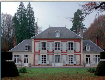
Château de Drucas - Amicale Laïque

Ce célèbre aviateur y a été transporté après le crash de son avion et y est décédé.