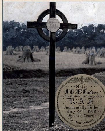
Première tombe de McCudden

Marcher prudemment sur le bas-côté enherbé jusqu'au Château de Drucas (propriété privée).