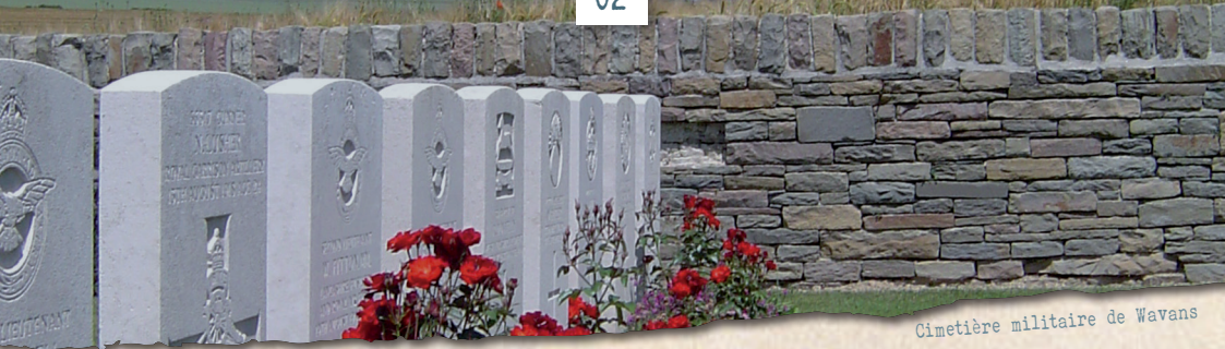
Cimetière militaire de Wavans