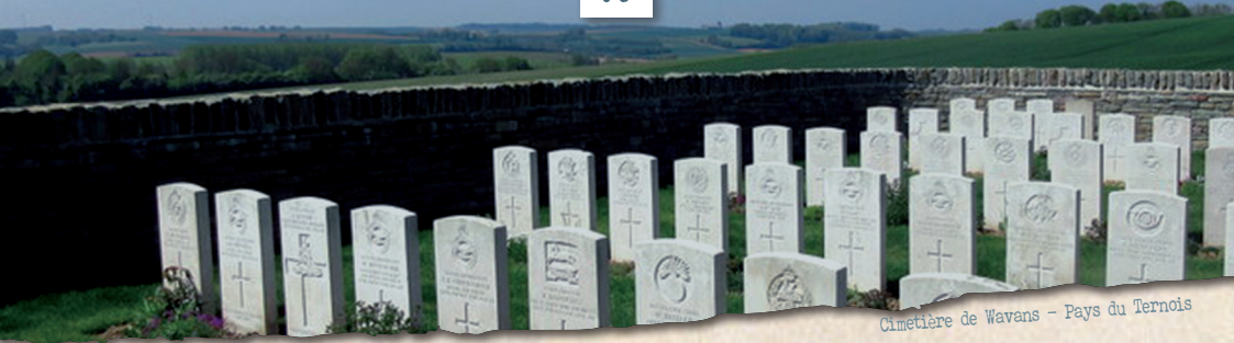
Cimetière de Wavans - Pays du Ternois