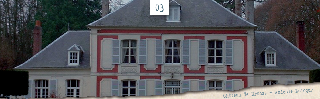
Château de Drucas - Amicale Laïque