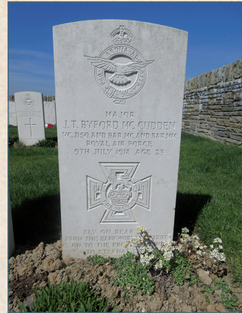
Tombe de McCudden, insigne de la Royal Air Force et sa devise "A travers les embûches jusqu'au étoiles" - Amicale Laïque

Ce cas de mariage franco-britannique n'est pas isolé, dans d'autres communes ; on retrouve des actes similaires.