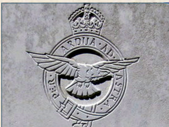
Tombe de McCudden - Amicale Laïque