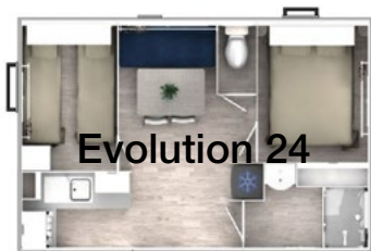
Emplacement N° 84