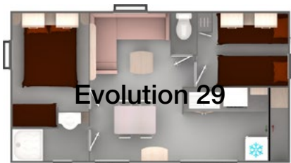
Emplacement N° 126