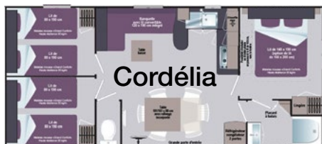
Emplacements N° 53 et 216